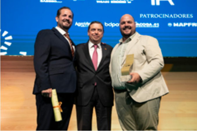
Los hermanos Viceira Puertas recibiendo el premio del MAPA de manos del ministro Luis Planas.