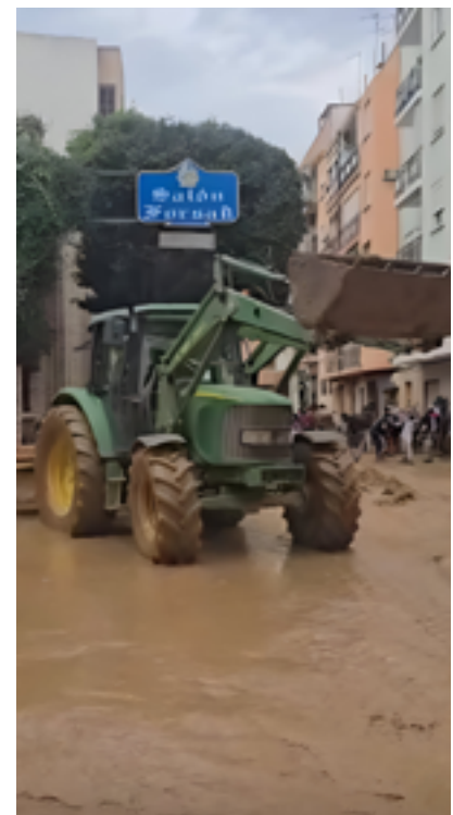
Tractores de algunos de nuestros granjeros, colaborando en la limpieza de lodo.