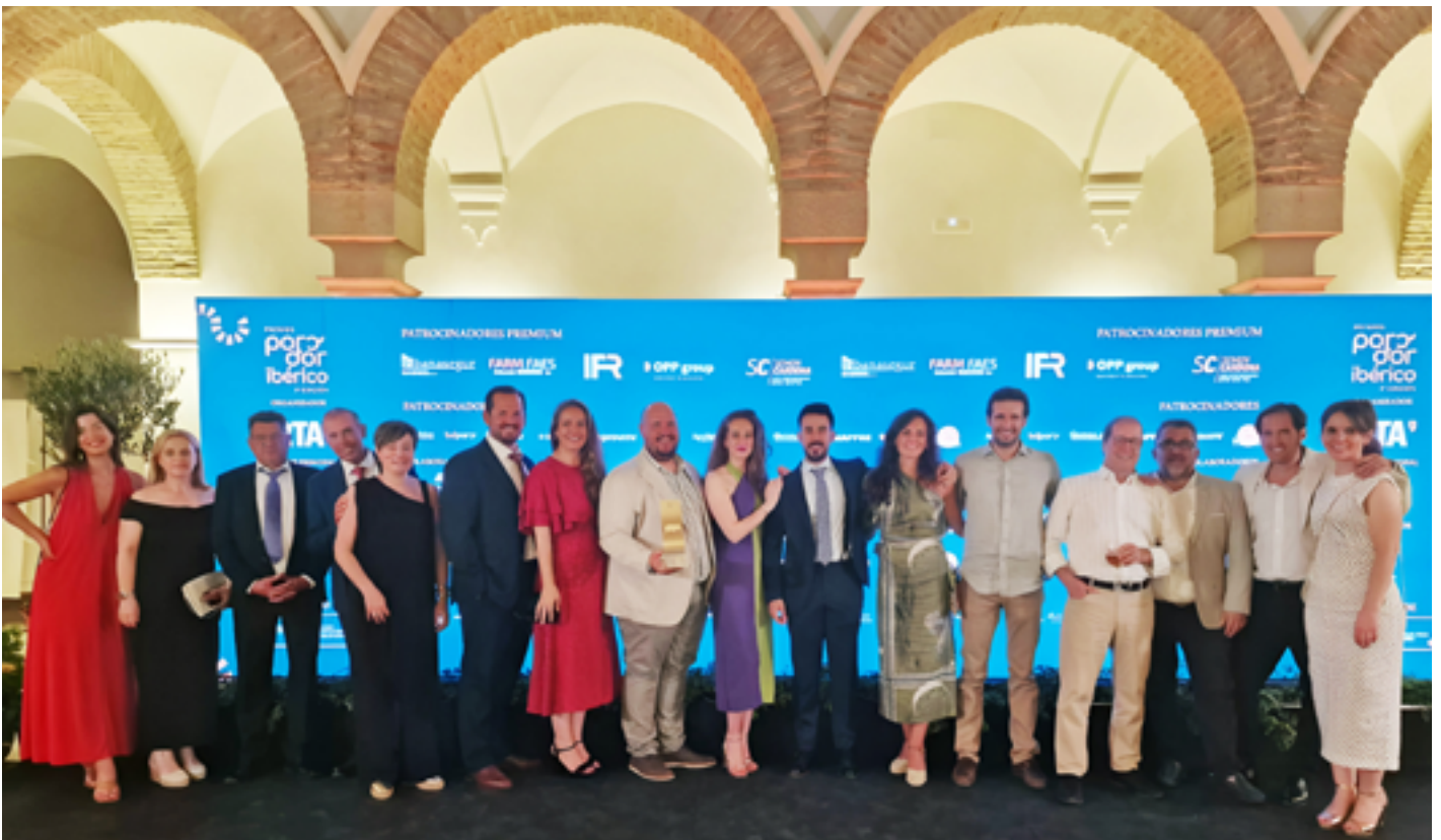
Miembros del equipo de Inga Food junto a los granjeros nominados y premiados en la Gala Porc d'Or 2024.