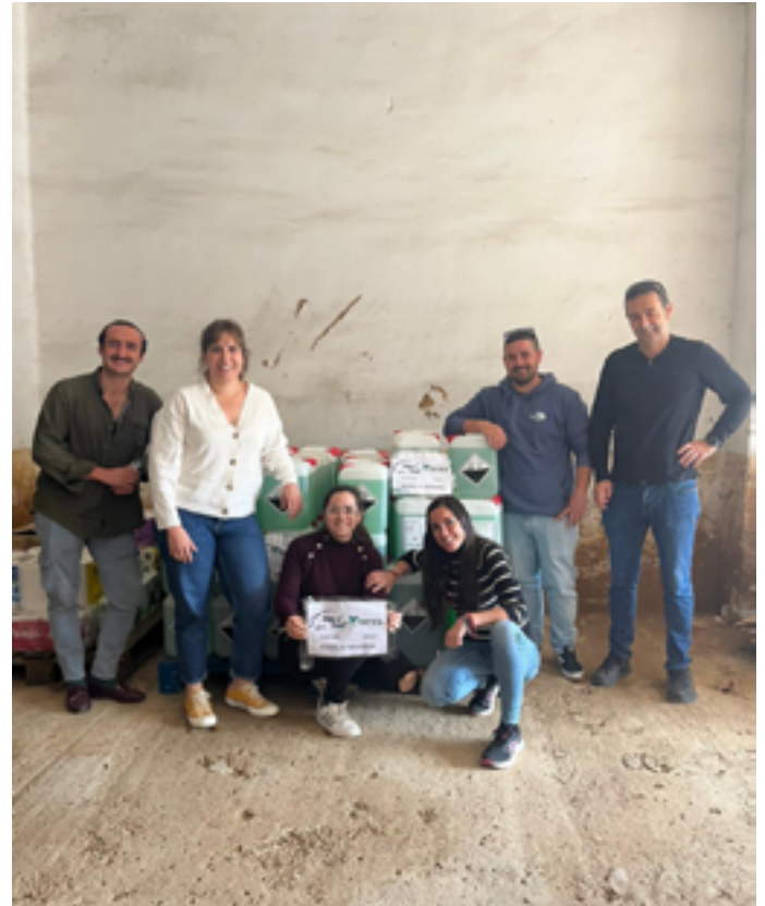
Compañeros de Inga Food organizando la donación de detergente.

Pero hay que reconocer que dentro de este desastre sin precedentes lo más positivo que podemos destacar ha sido la gran solidaridad llegada de todos los puntos del país. Un gran número de voluntarios anónimos pertrechados con botas y cepillos han invadido las zonas afectadas con la única intención de arrimar el hombro e intentar aportar ese granito de arena tan necesario para la gente afectada por la catástrofe.