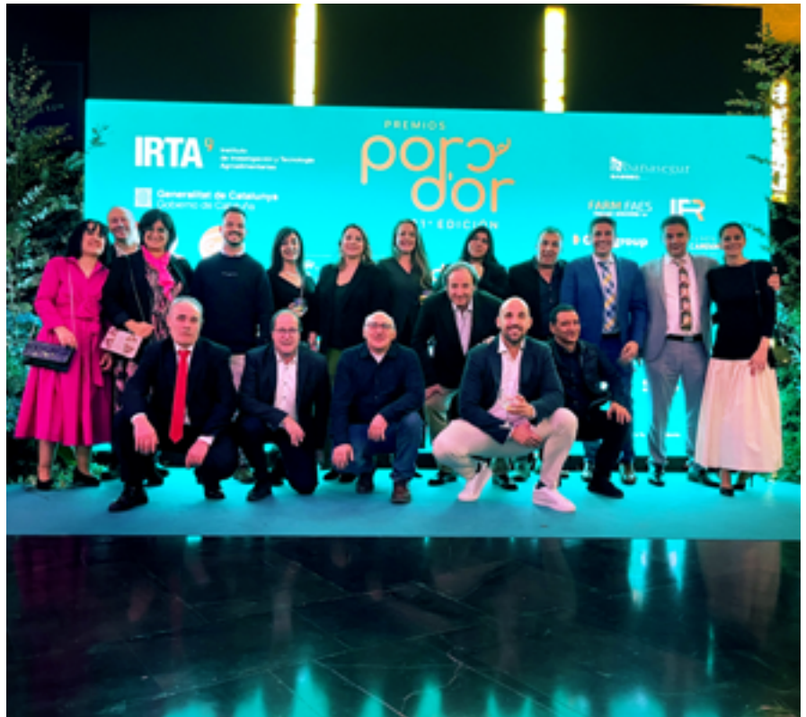
Nominados y ganadores de los premios Porc d'Or 2024, acompañados de parte del equipo de Inga Food.

El pasado viernes 29 de noviembre se celebró la XXXI Gala de los Premios Porc d'Or en Zaragoza. En esta gala se reconoce el trabajo bien hecho de los profesionales del sector porcino de capa blanca de España. El Banco de Datos del Porcino Español, dependiente del IRTA, analiza y valora los resultados técnicos de las granjas de reproductoras del año anterior, concediendo diferentes premios: Productividad Numérica, Tasa de Partos, Longevidad y Manejo en Lactación, así como el Porc d'Or de Diamante. El Ministerio de Agricultura, Pesca y Alimentación (MAPA) concede el premio a la Sostenibilidad. Y los Laboratorios Ceva otorgan el premio One Health, poniendo en valor el trabajo tanto del granjero como del veterinario.