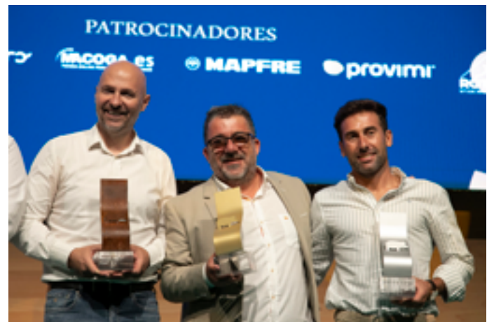
Ibéricos Jimena recogiendo su premio a la Longevidad en 3ª categoría.