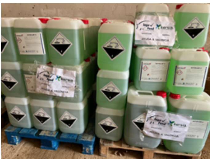
Detergente donado por Inga Food y Kersia a Alfafar.

Un ejemplo claro lo tenemos en localidades muy afectadas por la DANA como Mira, Talayuelas o Utiel, donde los ganaderos de la zona se volcaron con sus tractores, palas y cubas para limpiar la zona de barro y achicar el agua de las viviendas y garajes inundados pudiendo devolver a la normalidad en muy poco periodo de tiempo a todas estas poblaciones.